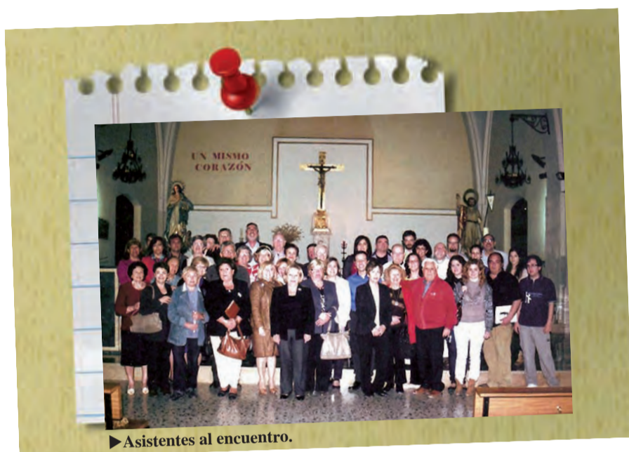
► Asistentes al encuentro.

El pasado sábado día cinco de mayo, la Parroquia de San Juan Bautista de Elche celebró un encuentro de confraternización con el lema « Conoce tu Parroquia », en donde participaron todos los servicios y grupos que configuran el consejo parroquial, dando cuenta de los diversos carismas, vocaciones y labores que desarrollan en la vida de la parroquia.