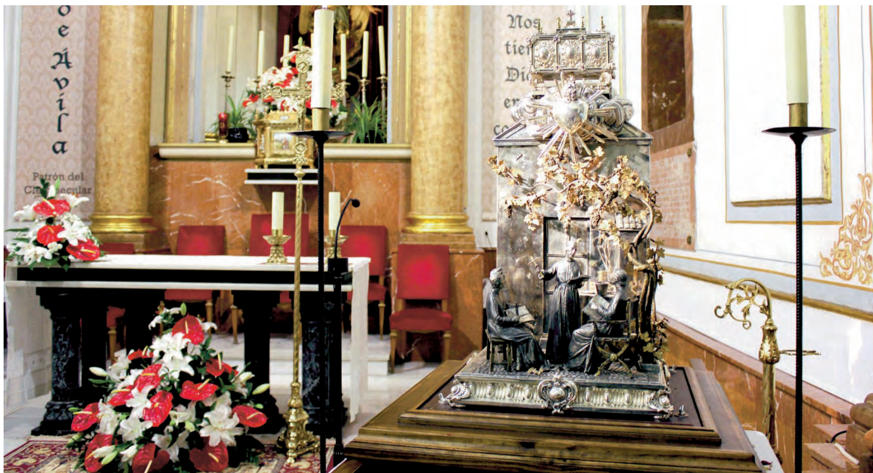
► Las reliquias de San Juan de Ávila llegan a Orihuela el 12 de mayo. En la imagen presiden la capilla del Seminario.

Durante los días 12 a 20 de mayo han visitado nuestra Diócesis las reliquias del santo patrono del clero español, San Juan de Ávila. Ha sido una ocasión de profundizar en la figura y espiritualidad del Maestro Ávila, que el próximo mes de octubre será declarado Doctor de la Iglesia.