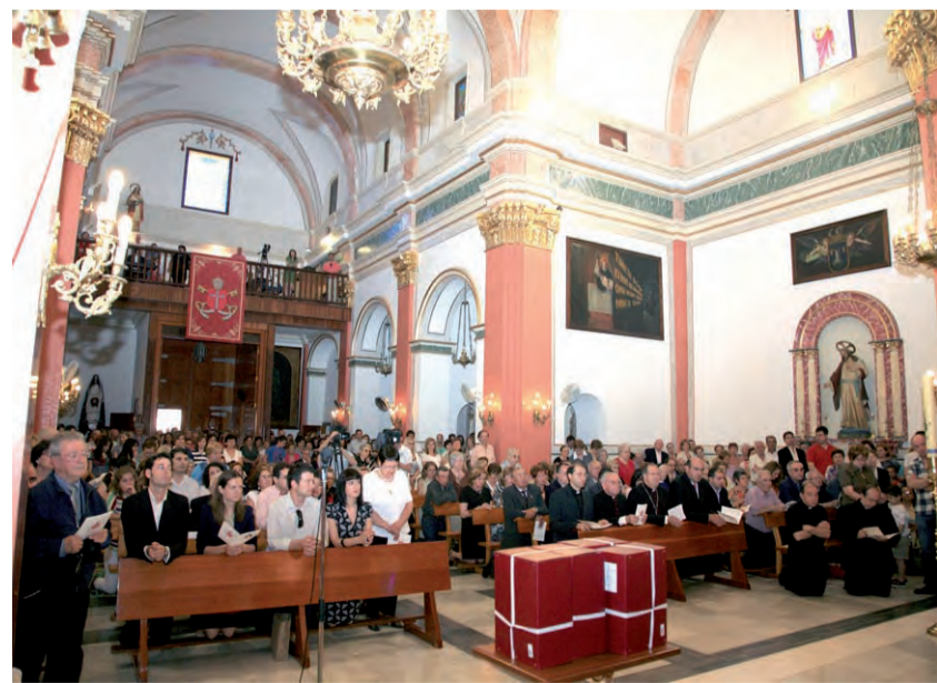
►La Iglesia Parroquial estaba a rebosar.